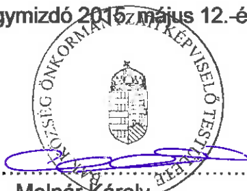
Molnár Károly polgármester Bak Község Önkormányzata