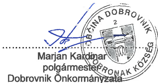
Marján Károlnár polgármester Dobrovnik Önkormányzata