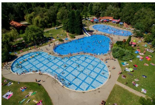
A Fényes Strandfürdő