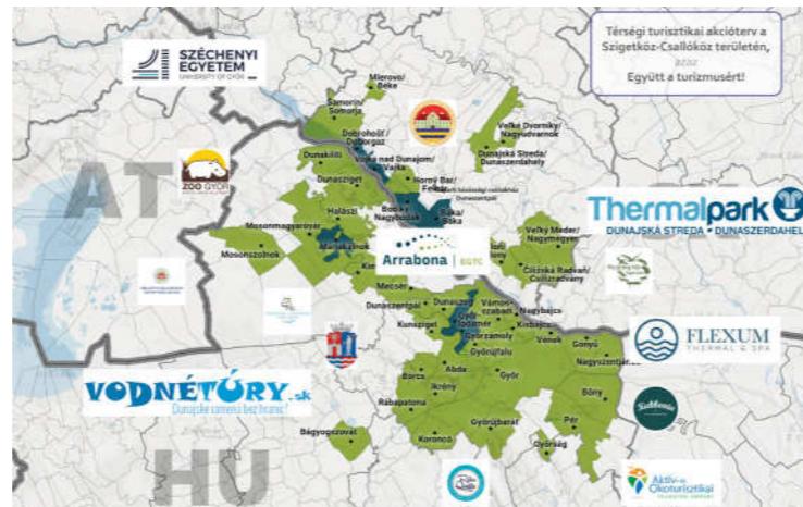
Az akcióterv potenciális résztvevői a Szigetköz-Csallóköz területén

A fejlesztés előkészítését megkezdjük, és kiakartásra került a határon átnyúló, térségi turisztikai akcióterv koncepciója, mely egyrészt a szezonális és szakipari munkaerőgazdálkodási problémákra ad választ, másrészt hálózatépítő tevékenységének köszönhetően ajánlati csomagokat fogalmaz meg.